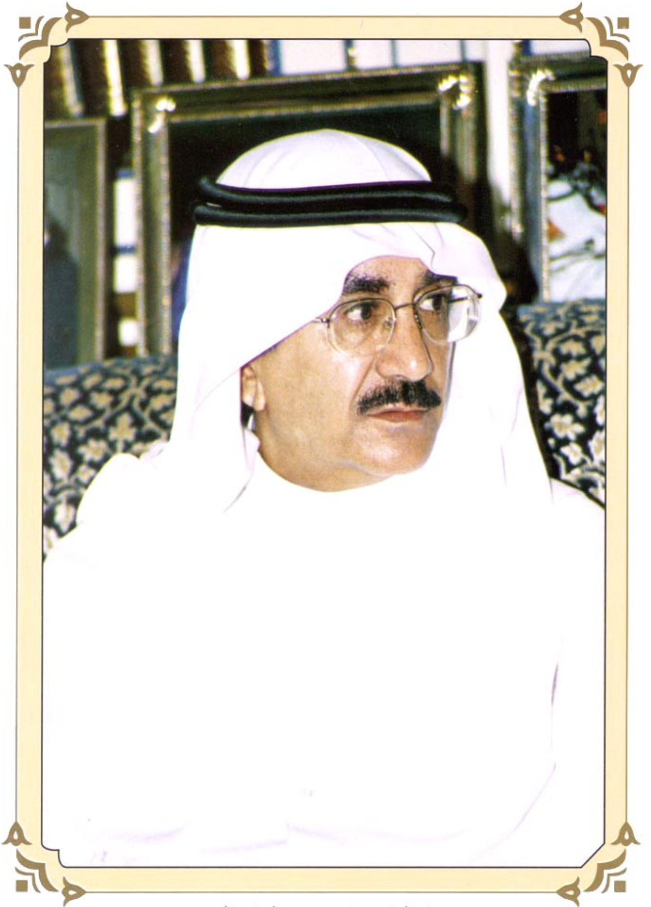
سعادة الدكتور تركي بن حمد التركي الحمد