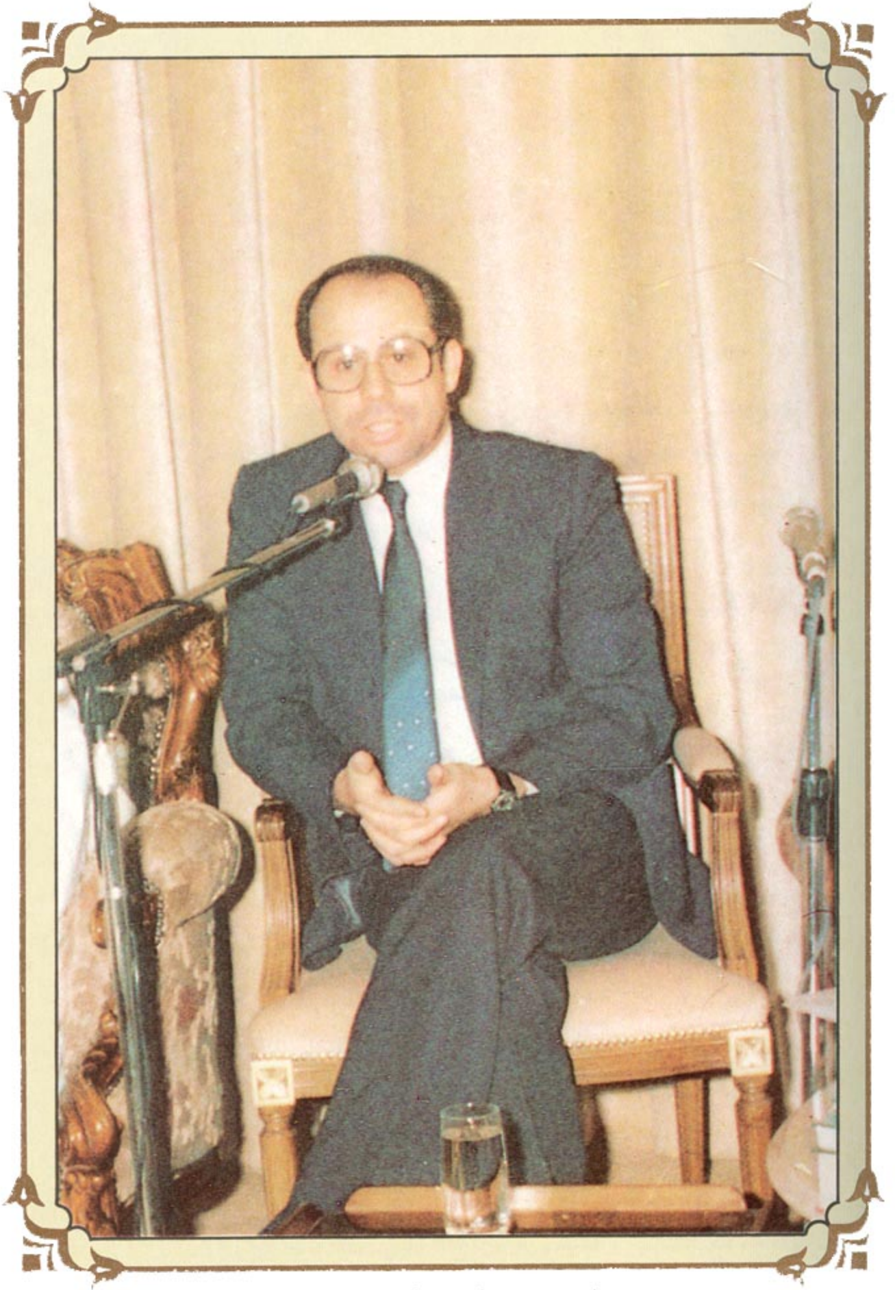
الدكتور عبد السلام المسدي