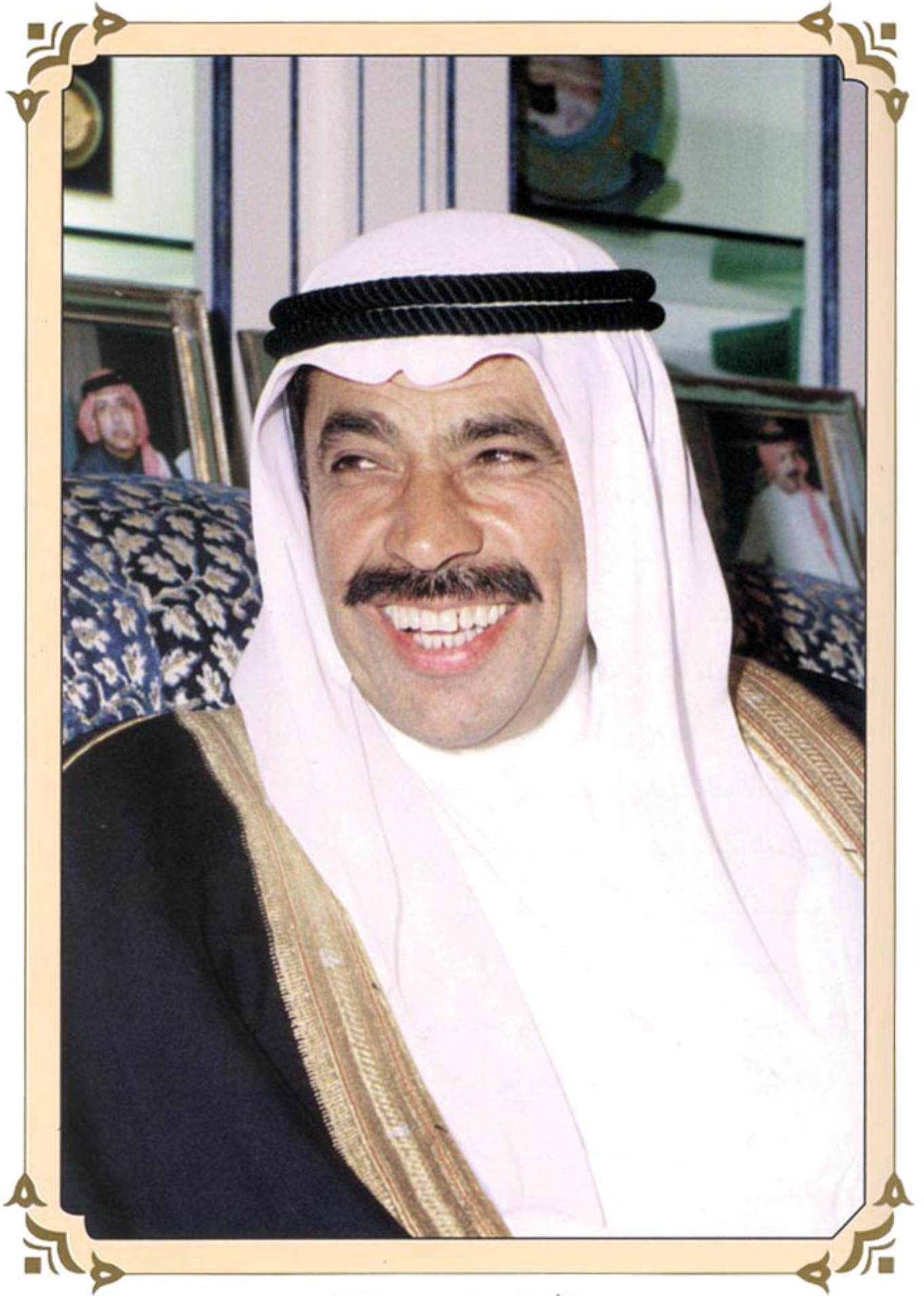
سعادة الأستاذ عبدالعزيز سعود البابطين