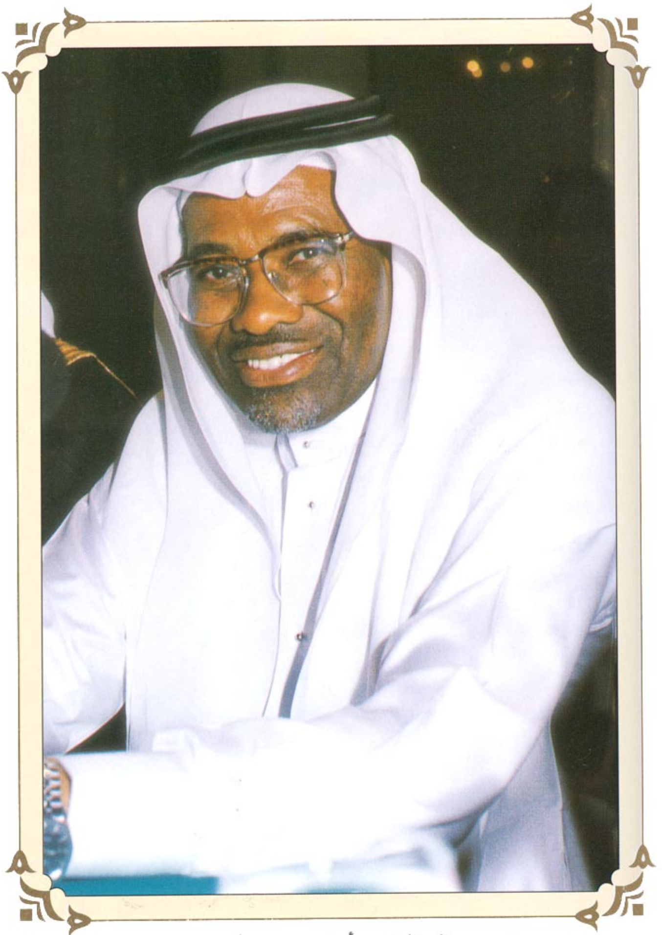
معالي الدكتور أحمد محمد علي