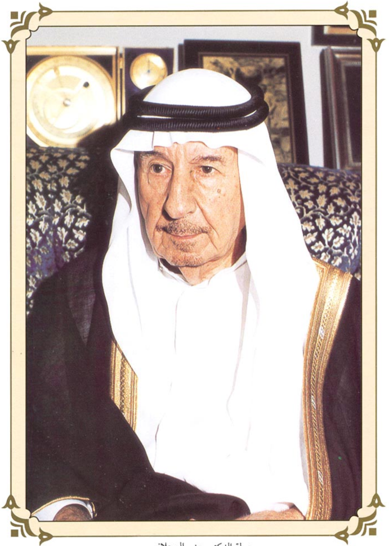
دولة الدكتور منير العجلاني